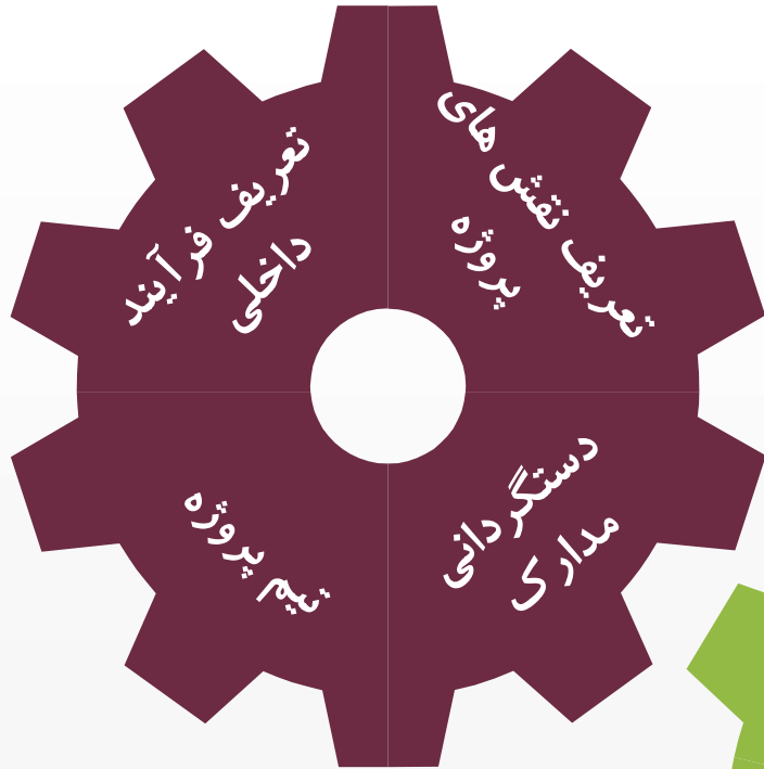
گردش داخلی مدارک