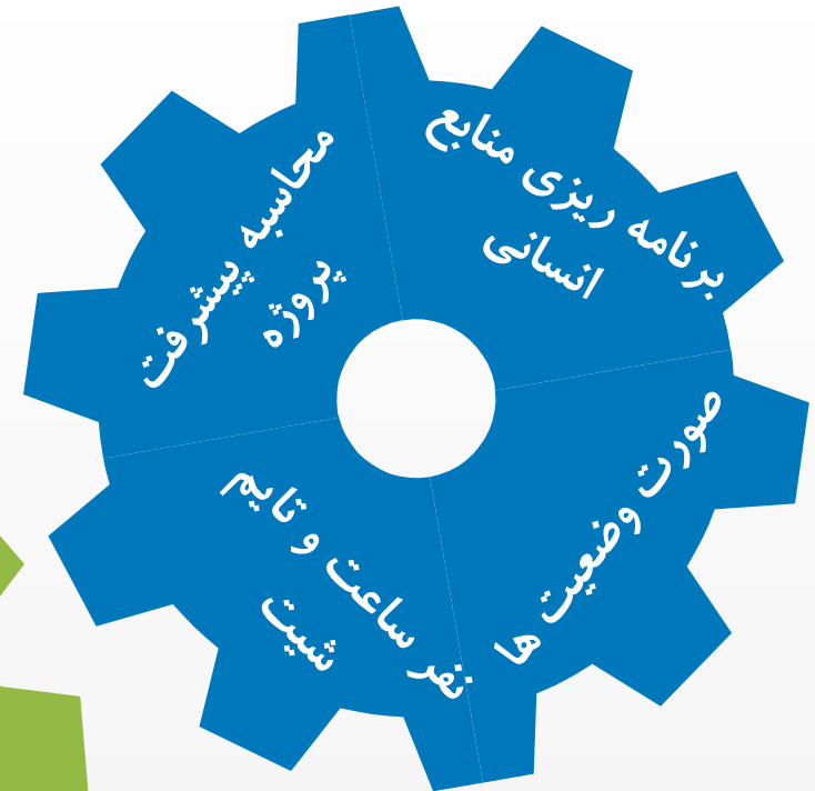
کنترل پروژه و مدیریت منابع